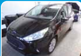
Ford B-Max 1.0 EcoBoost SYNC Edition Navi, Winter-Paket

Schwarz, 14.077 km, 74 KW (101 PS) 06/2017 14.995,- €