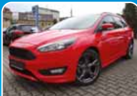
Ford Focus 1.0 EcoBoost, ST-Line Navi, Winter-Paket

Grau, 47.968 km, 92 KW (125 PS) 01/2015 10.985,- €