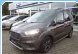
Ford Tourneo Courier 1.0 EcoBoost Sport Facelift 2018

Blau, 18.921 km, 184 KW (250 PS) 05/2017 23.985,- €