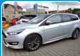
Ford Focus 1.5 EcoBoost ST-Line Navi, Winter-Paket

Rot, 16.844 km, 103 KW (140 PS) 12/2017 19.995,- €