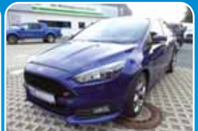
Ford Focus 2.0 EcoBoost ST, Navi Leder-Sport-Paket, Bi-Xenon

Silber, 21.713 km, 110 KW (150 PS) 11/2017 19.995,- €