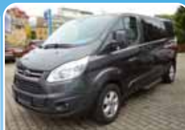
Ford Tourneo Custom 310 L2H1 Titanium Navi, Sicht-Paket 3

Grau, 24.450 km, 88 KW (120 PS) 02/2018 23.950,- €