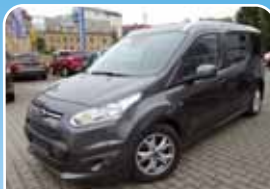
Ford Tourneo Connect Titanium L2 Automatik Navi, AHK

Rot, 20.640 km, 110 KW (150 PS) 12/2017 19.895,- €