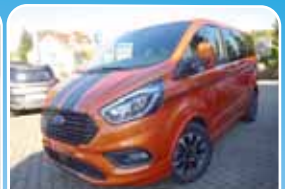
Ford Tourneo Custom 310 L1H1 Autm. Sport Vollausstattung

Grau, 22.008 km, 96 KW (131 PS) 12/2017 27.985,- €