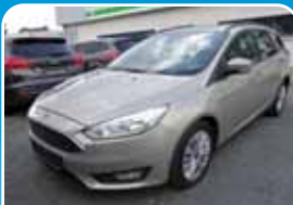
Ford Focus 1.0 EcoBoost Trend Turnier Frontscheibe beheizt

Schwarz, 14.077 km, 74 KW (101 PS) 06/2017 14.995,- €