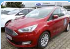
Ford C-Max 1.5 EcoBoost Titanium Xenon, Navi, Winter-Paket

Grau, 1.900 km, 74 KW (101 PS) 10/2018 18.995,- €