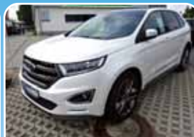
Ford Edge 2.0 TDCi Allrad, Automatik AHK, STHZG, PANORAMA Weiß, 14.900 km, 154 KW (209 PS) 09/2017 44.995,- €