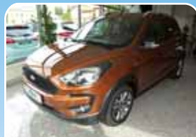
Ford Ka+ 1.2 Active Technologie-Paket Winter-Paket Braun, 1.900 km, 63 KW (85 PS) 09/2017 15.995,- €