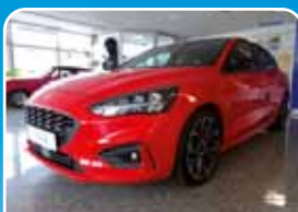
Ford Focus 1.0 Ecoboost ST-Line Modell 2018, LED, Navi Rot, 1.900 km, 92 KW (125 PS) 08/2018 22.995,- €