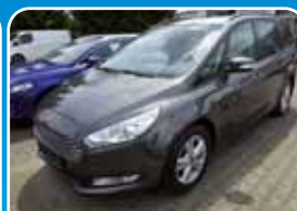
Ford Galaxy 1.5 Ecoboost Business Sicht-/Winter-Paket Grau, 22.510 km, 118 KW (160 PS) 09/2017 25.895,- €