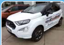
Ford Eco-Sport 1.0 ST-Line Xenon, Navi, B&O Play Weiß, 1.900 km, 92 KW (125 PS) 07/2018 21.495,- €