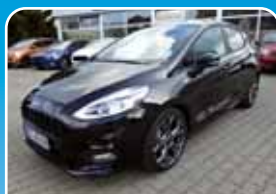
Ford Fiesta 1.0 Ecoboost ST-Line Navi, B&O, Easy-Driver Schwarz, 3.900 km, 74 KW (101 PS) 03/2018 17.495,- €