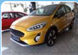
Ford Fiesta 1.0 Active Colourline, Navi B&O, LED-Scheinwerfer Gelb, 1.900 km, 92 KW (125 PS) 07/2018 20.900,- €