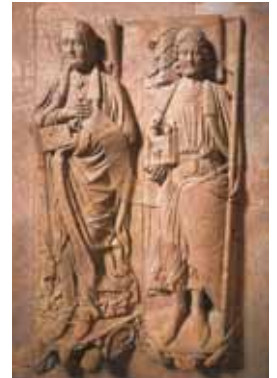
Grabmal des Gründers Dedo von Groitzsch (der Feiste) mit seiner Gemahlin Mechtild (Rochlitzer Porphyr)