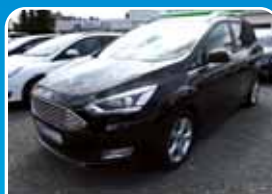
Ford Grand C-Max 2.0 TDCi Titanium Atom. Xenon, Navi, Winter-Paket Schwarz, 37.182 km, 110 KW (150 PS) 01/2016 19.995,- €