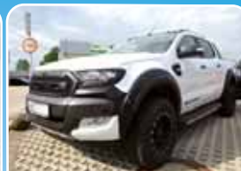
Ford Ranger 3.2 Autom. Wildtrak Offroad-Paket Weiß, 4.900 km, 147 KW (200 PS) 06/2018 42.990,- €