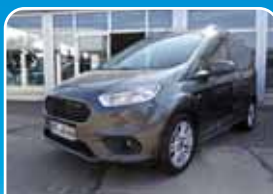
Ford Tourneo Courier 1.0 Ecoboost, Titanium Navi, Winter-Paket 2 Grau, 1.900 km, 74 KW (101 PS) 07/2018 16.985,- €