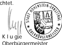
K. U. G. l. e Oberbürgermeister

Bei beigefügtem, ausreichend frankiertem Rückumschlag werden die Unterlagen von nicht berücksichtigten Bewerbern zurückgeschickt bzw. können nach Abschluss des Bewerbungsverfahrens zu den Öffnungszeiten der Stadtverwaltung in der Personalabteilung abgeholt werden, anderenfalls werden die Unterlagen vernichtet.