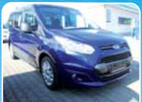
Ford Tourneo Connect 1.5 TDCi 230 L2 Trend Winter-Paket, 7-Sitzer