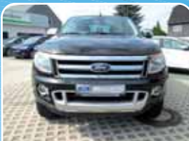
Ford Ranger 2.2 TDCi Autom. 4x4 Limited DOKA Navi, Style-X

Schwarz, 94.523 km, 110 KW (150 PS) 06/2012