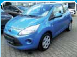
Ford Ka 1.2 Trend Winter-Paket