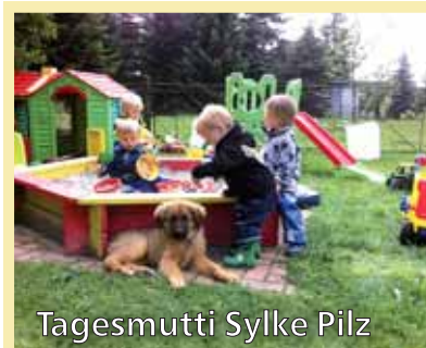
Tagesmutter Sylke Pilz