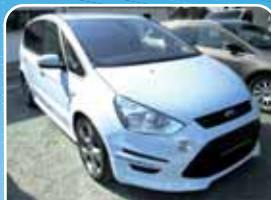
Ford S-Max 2.0 EcoBoost Aut. Titanium S IVDC, Navi, AHK

Weiß, 121.745 km, 149 KW (203 PS) 03/2011