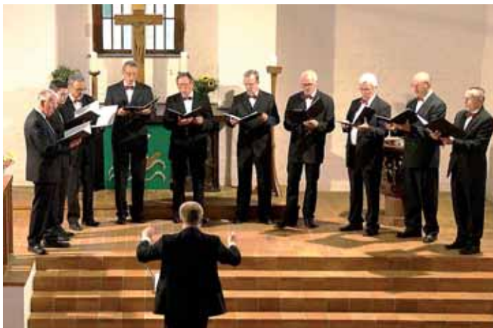
Der Männerchor bei einem Auftritt in Görlitz.