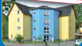
SERVICE-WOHNEN „AM SCHÜTZENHAUS“