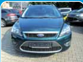
Ford Focus Turnier 1.8 Titanium Winter-Paket, Sony-CD, Leder