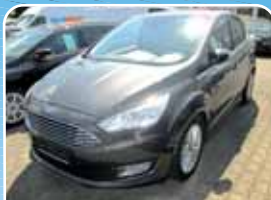
Ford C-Max 2.0 TDCi Titanium Navi, Technologie, Panorama

Grau, 23.049 km, 110 KW (150 PS) 08/2015