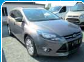
Ford Focus Turnier 1.6 TDCi Titanium Technologie-Paket, Navi

Braun, 138.897 km, 85 KW (116 PS) 09/2011