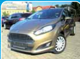
Ford Fiesta 1.0 Trend Easy-Driver-Paket 2, Winter-Paket