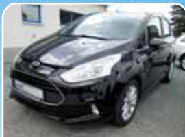
Ford B-Max 1.0 EcoBoost Titanium Easy-Driver-Paket 3

Schwarz, 19.872 km, 92 KW (125 PS) 02/2015