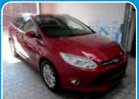
Ford Focus Turnier 1.6 EcoBoost Titanium Xenon, Winter-Paket