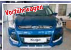
Vorfürswagen Ford Kuga 2.0 TDCi 4x4 Aut. Individual, Volllausstattung EZ 06/2014, Blau 6.900 km, 120 kW 34.900,- €