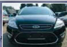
Ford Mondeo Turnier 2.0 TDCi Business-Edition, Navi, PDC EZ 2/2014, Schwarz 1.133 km, 120 kW 20.900,- €*