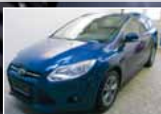
Ford Focus 1.6 TDCi SYNC Edition Navi, Fahrer-Assistenz-Paket EZ 12/2013, Blau 18.773 km, 85 kW 17.450,- €*