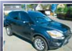
Ford Kuga 2.0 TDCi 4x4 Titanium Winter-Paket EZ 06/2009, Grau 87.714 km, 100 kW 15.900,- €*