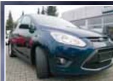
Ford C-Max EcoBoost, Champion- Edition, Navi, Winter-Paket EZ 05/2013, Blau 23.188 km, 74 kW 15.900,- €*