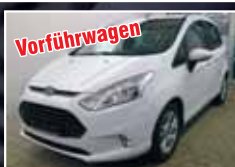
Vorfürswagen Ford B-Max 1.0 EcoBoost, SYNC-Edition, Winterpaket EZ 03/2014, Weiß 3.900 km, 74 kW 14.900,- €*

Bewerbungs - & Pass-Fotos / auch sofort zum Mitnehmen