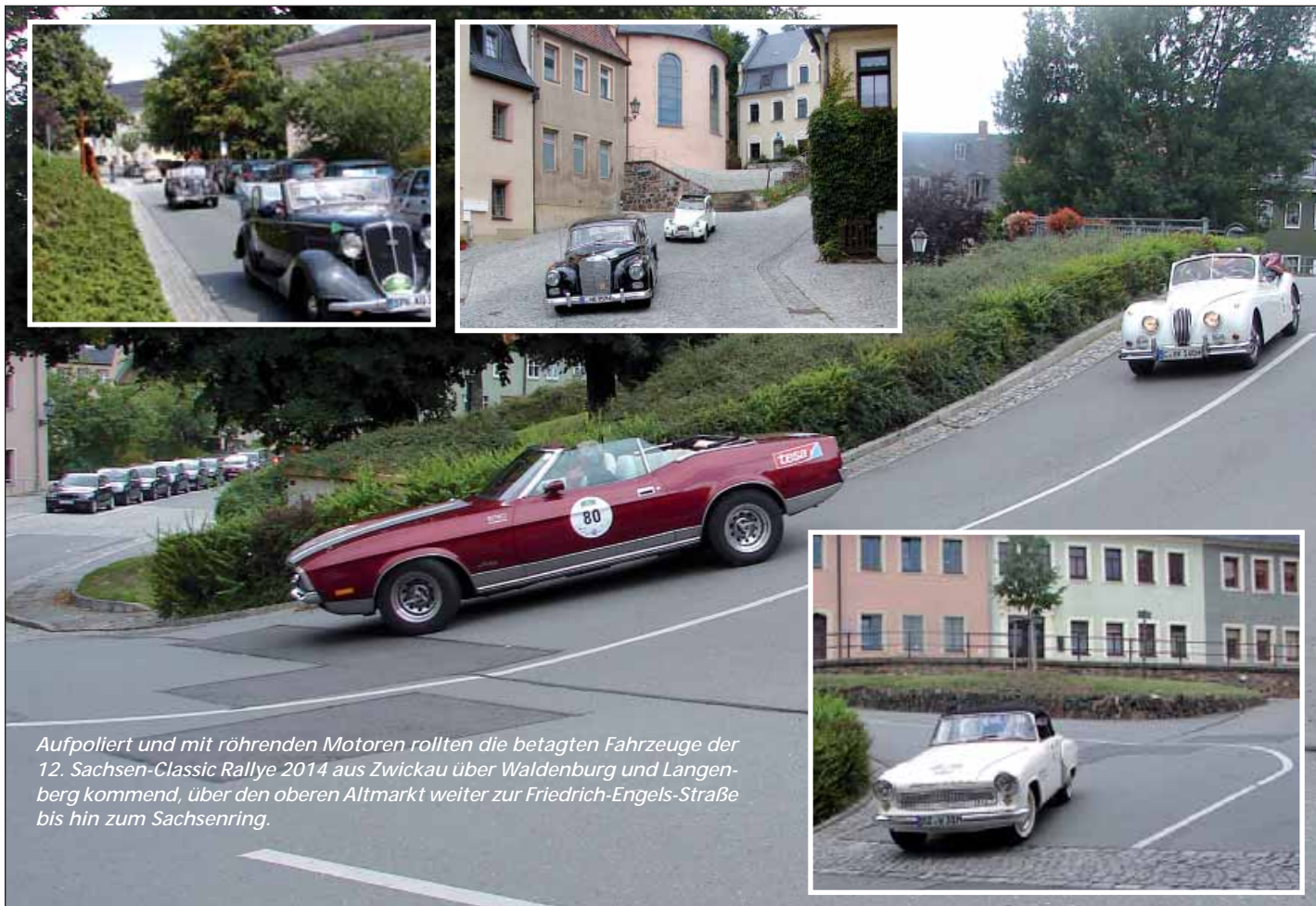
Aufpoliert und mit röhrenden Motoren rollten die betagten Fahrzeuge der 12. Sachsen-Classic Rallye 2014 aus Zwickau über Waldenburg und Langenberg kommend, über den oberen Altmarkt weiter zur Friedrich-Engels-Straße bis hin zum Sachsenring.