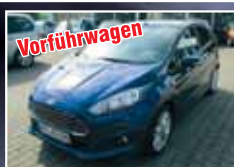
Vorfürswagen Ford Fiesta 1.0 EcoBoost SYNC Edition EZ 08/2014, Indio-Blau Met. 900 km, 74 kW 14.990,- €*