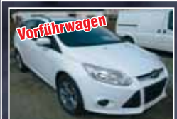
Vorfürswagen Ford Focus Turnier 1.6 TDCi SYNC Edition, Winter-Paket EZ 06/2014, Weiß 3.900 km, 70 kW 16.895,- €*