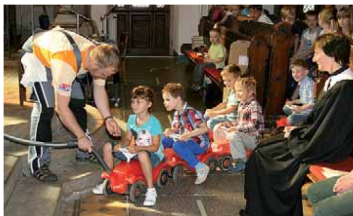
Familiengottesdienst zum Schulanfang.