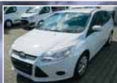
Ford Focus Turnier 1.6 TDCi DPF Trend, Winter-Paket EZ 05/2011, Weiß 65.571 km, 70 kW 11.900,- €*