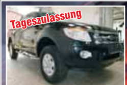
Tageszulassung Ford Ranger 2.2 TDCi Extra-Kabine XLT, Tageszulassung EZ 07/2014, Schwarz 50 km, 110 kW 25.900,- €*