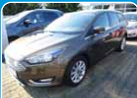
Ford Focus 1.0 EcoBoost Titanium Navi, Rückfahrkamera Braun, 20.445 km, 92 KW (125 PS) 07/2017 17.485,- €