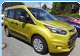
Ford Tourneo Connect 1.0 EcoBoost Trend Rückfahrkamera Gelb, 13.521 km, 74 KW (101 PS) 07/2017 17.495,- €