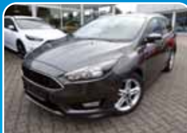
Ford Focus 1.0 EcoBoost, Titanium Sport-Paket Grau, 4.901 km, 92 KW (125 PS) 11/2017 19.795,- €