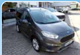
Ford Tourneo Courier 1.0 EcoBoost Titanium Navi, Winter-Paket 2 Grau, 1.900 km, 74 KW (101 PS) 07/2018 16.985,- €