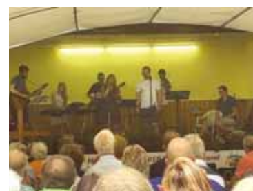
Im Gottesdienst zum Wüstenbrand Heidelbergfest musizierte eine Band aus allen drei Stadtgemeinden.