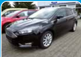
Ford Focus 1.5 TDCi Titanium Navi, Leder, Techn.-Paket Schwarz, 35.651 km, 88 KW (120 PS) 05/2017 16.590,- €