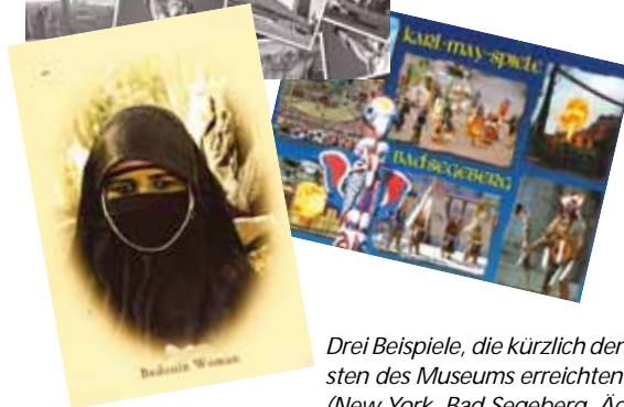
Drei Beispiele, die kürzlich den Briefkasten des Museums erreichten (New York, Bad Segeberg, Ägypten).