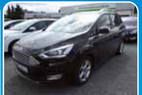
Ford Grand C-Max 2.0 TDCi Titanium Atom. Xenon, Navi, Winter-Paket Schwarz, 37.182 km, 110 KW (150 PS) 01/2016 19.995,- €