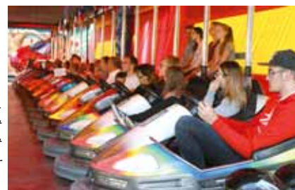
Dank, Lob und Bitte im Autoscooter: Am 12. August feierten wir zusammen mit den Schaustellern wieder den Bergfest-Gottesdienst.