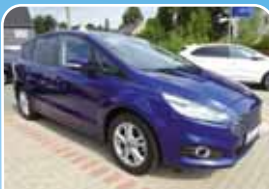
Ford S-Max Business Edition Navi, Kamera, 7-Sitzer Blau, 23.563 km, 118 KW (160 PS) 10/2017 25.895,- €