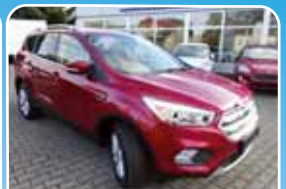
Ford Kuga 1.5 EcoBoost Titanium Navi, KeyFree, Winter-Paket Rot, 21.226 km, 110 KW (150 PS) 10/2017 23.995,- €