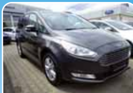
Ford Galaxy 1.5 EcoBoost Business Sicht-/Winter-Paket Grau, 22.510 km, 118 KW (160 PS) 05/2017 25.895,- €