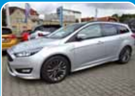
Ford Focus 1.5 EcoBoost ST-Line Navi, Winter-Paket Silber, 21.713 km, 110 KW (150 PS) 11/2017 19.995,- €