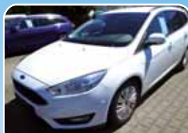
Ford Focus 1.5 TDCi Business Turn. Auto. Navi, Winter-Paket Weiß, 39.347 km, 88 KW (120 PS) 04/2017 15.785,- €