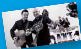
die Band mit dem Dudelsack - A'N'T