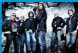
die deutsche Rockband aus Leipzig Karussell