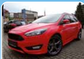
Ford Focus ST-Line 1.0 Ecoboost, 140 PS Business Paket 2 Rot, 16.844 km, 103 KW (140 PS) 12/2017 19.995,- €