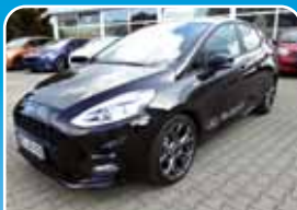
Ford Fiesta 1.0 Ecoboost ST-Line Navi, B&O, Easy-Driver Schwarz, 3.900 km, 74 KW (101 PS) 03/2018 17.900,- €