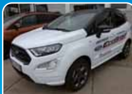
Ford EcoSport ST-Line 1.0 Ecoboost, Xenon, Navi, B&O Play Weiß, 1.900 km, 92 KW (125PS) 07/2018 21.990,- €