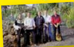
handgemachte Musik von den Little Country Gentlemen

Hohenstein-Ernstthal auf dem Festgelände Pfaffenberg