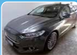
Ford Mondeo 1.6 EcoBoost Titanium Lim. Navi, RFK, Panoramadach Grau, 19.718 km, 118 KW (160 PS) 05/2017 22.395,- €