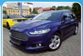
Ford Mondeo 2.0 TDCi Titanium Business 2, AHK, LED Blau, 24.198 km, 110 KW (150 PS) 10/2017 23.985,- €