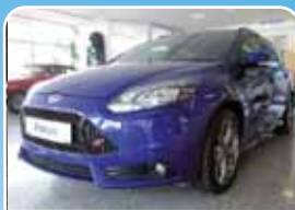
Ford Focus 2.0 ST Leder-Sport-Paket Bi-Xenon, Navi Blau, 18.921 km, 184 KW (250 PS) 05/2017 23.985,- €