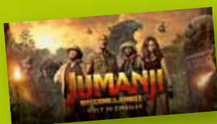
Kinonacht auf dem Pfaffenberg „Jumanji“ mit Popcorn