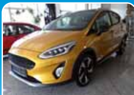
Ford Fiesta 1.0 Active Colorline Navi, B&O, LED Scheinwerfer Gelb, 1.900 km, 92 KW (125PS) 07/2018 20.900,- €