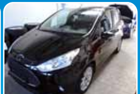
Ford B-Max 1.0 EcoBoost SYNC Edition Navi, Winter-Paket Schwarz, 14.077 km, 74 KW (101 PS) 03/2018 15.485,- €