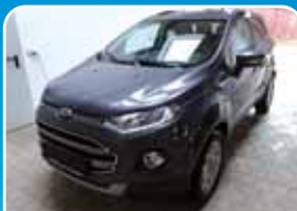
Ford EcoSport Titanium 1.0 Ecoboost, Navi Winter-Paket Grau, 20.796 km, 92 KW (125 PS) 09/2017 16.950,- €