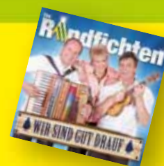
Partystimmung mit De Randfichten und Freunde

Das Programmheft liegt dem Amtsblatt bei.