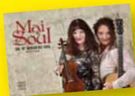
Country Duo Mai Soul