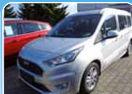
Ford Tourneo Connect 310 L2 Titanium ACC, Navi, TECHNOLOGIE

Silber, 23.981 km, 88 KW (120 PS) 08/2018