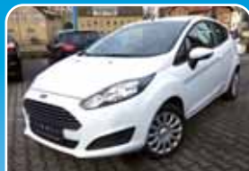
Ford Fiesta 1.25i Trend Klimaanlage