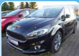
Ford S-Max 1.5 EcoBoost ST-Line LED, Navi, ALCANTARA

Schwarz, 23.361 km, 118 KW (160 PS) 02/2018