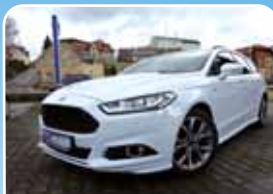
Ford Mondeo 2.0 ST-Line Turnier ACC, LED, Panoramadach

Weiß, 24.210 km, 176 KW (239 PS) 08/2018