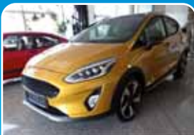
Ford Fiesta 1.0 Active, Colourline Navi, B&O, LED