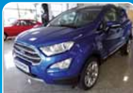
Ford EcoSport 1.0 EB Autom. Titanium Navi, XXenon, AHK