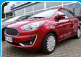
Ford Ka/Ka+ 1.0 Cool& Connect Winter-Paket