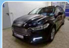
Ford Mondeo 1.5 EB Business Edition Navi, Winter-Paket

Schwarz, 24.741 km, 121 KW (165 PS) 07/2018