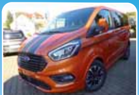
Ford Tourneo Custom Sport, ACC, Xenon Navi, Standheizung

Orange, 14.900 km, 125 KW (170 PS) 10/2018