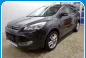
Ford Kuga 2.0 TDCi 4x4 Automatik, Individual Xenon, Navi, Winter-Paket

Grau, 49.998 km, 132 KW (179 PS) 10/2015