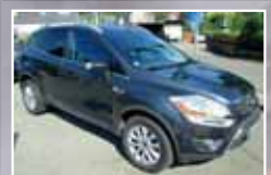
Ford Kuga 2.0 TDCi 4x4 Titanium, Winter-Paket EZ 06/2009, Grau 87.714 km, 100 kW (136 PS) 14.900,- €*