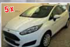
5x Ford Fiesta SYNC-Edition, Diesel/Benzin, 3-/5-türig EZ 2014, verschiedene Farben ab 11.900,- €*