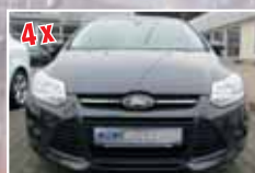
4x Ford Focus SYNC-Edition, Diesel/Benzin, 5-trg./Turnier EZ 2014, verschiedene Farben ab 15.900,- €*