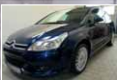
Citroen C4 Coupe 1.6 16V VTR, FOX Auspuff, OZ-Felgen EZ 02/2008, Blau 62.264 km, 80 kW (109 PS) 5.900,- €*

Tageszulassungen, Vorführwagen sowie Halbjahres- und Jahreswagen am Lager.