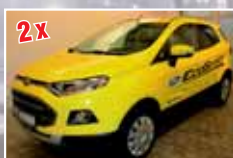
2x Ford EgoSport 1.0 EcoBoost Titanium EZ 11/2014, Gelb/Blau 3.900 km, 92 kW (125 PS) ab 15.995,- €*