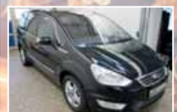
Ford Galaxy 2.0 TDCi Titanium, Sitz-Paket EZ 04/2014, Schwarz 21.328 km, 103 kW (140 PS) 25.900,- €*