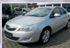
Opel Astra 1.4 Turbo Design Edition, PDC, Lenkrad beheizt EZ 09/2011, Silber 34.028 km, 103 kW (140 PS) 10.900,- €*