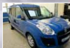
Fiat Doblo Cargo 1.6 Multijet MAXI SX, LKW-Zulassung EZ 02/2011, Blau 72.540 km, 77 kW (105 PS) 11.500,- €*