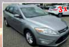
3x Ford Mondeo Business-Edition, Diesel/Benzin, 5-trg./Turnier EZ 2014, verschiedene Farben ab 19.900,- €*