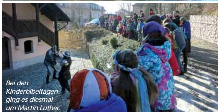
Bei den Kinderbibeltagen ging es diesmal um Martin Luther.