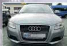
Audi A3 1.8 TFSI Ambiente, Neuer Motor EZ 08/2008, Grau 81.250 km, 118 kW (160 PS) 11.450,- €*